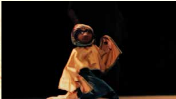
Simón Tormenta de arena