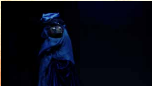
Nadir Punto contrario al cenit