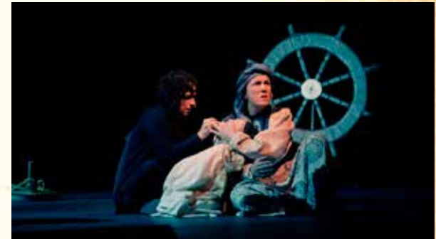
Nahla Gota de agua